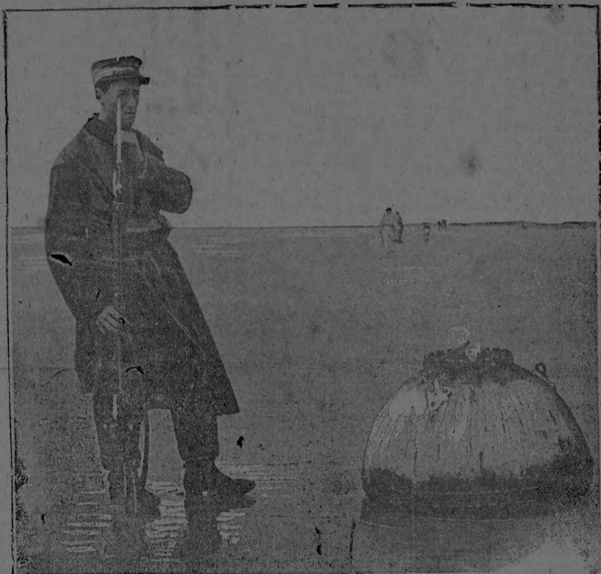
Centinela danés guardando una mina flotante que las olas llevaron suavemente a la orilla y que se varó en la arena sin explotar

el momento propicio. El resultado de la conferencia del Rey con los Jefes de la oposición, se considera en los círculos competentes que ha satisfecho enteramente la opinión pública.